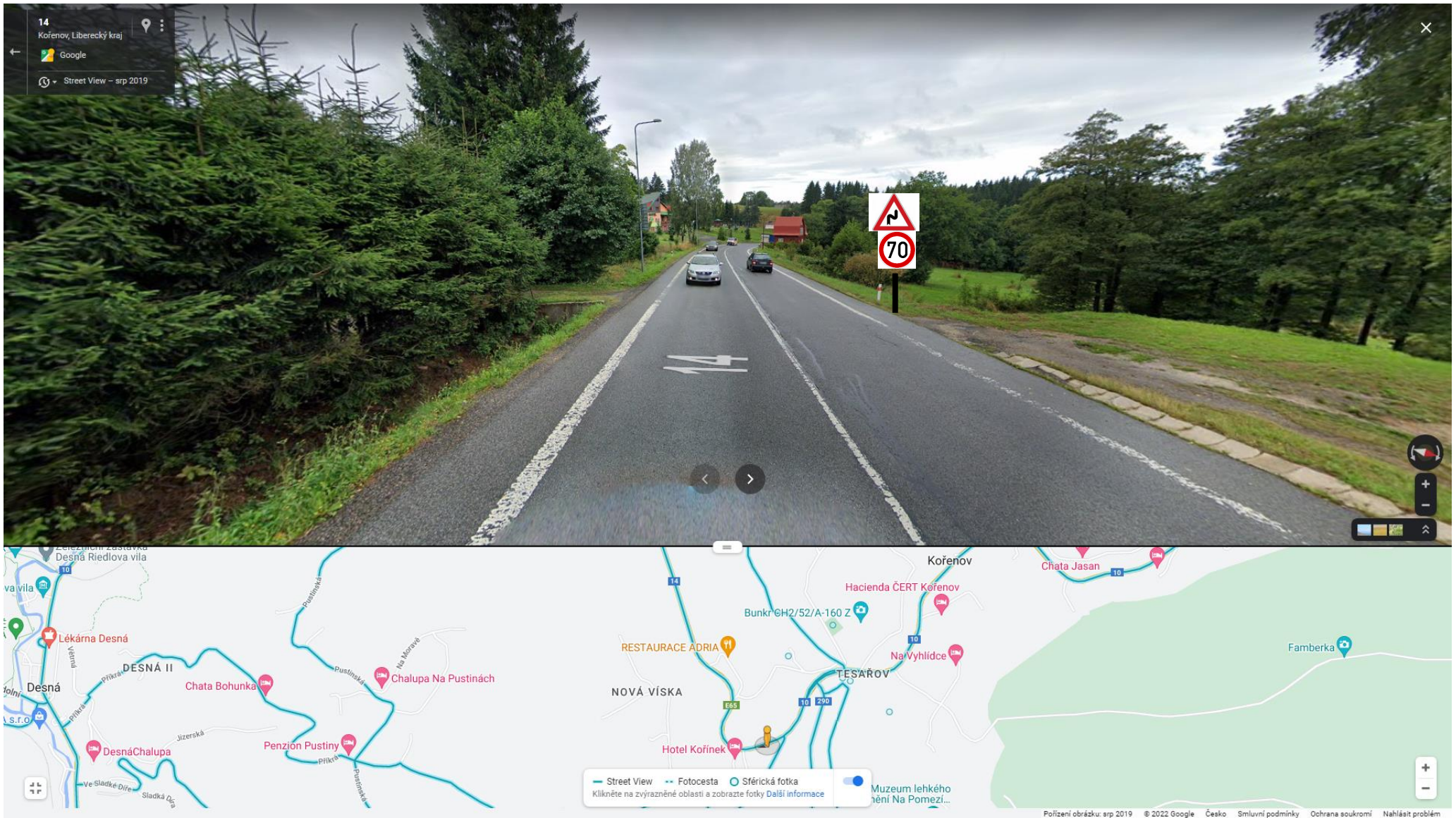
Detail návrhu místa pro instalaci B20a 70 a A2a, pohled od Harrachova na Desnou