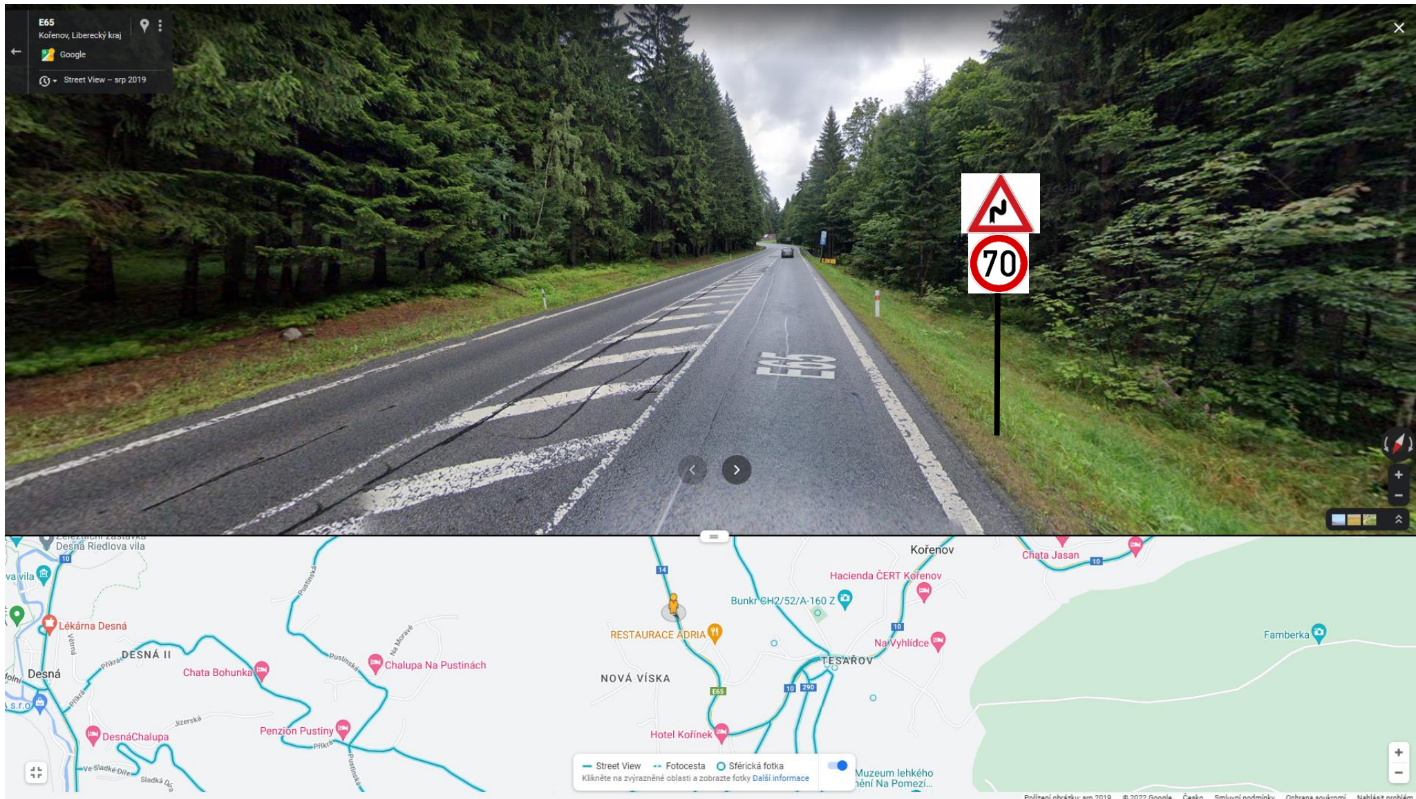
Detail návrhu místa pro instalaci B20a 70 a A2a, pohled od Desné na Harrachov